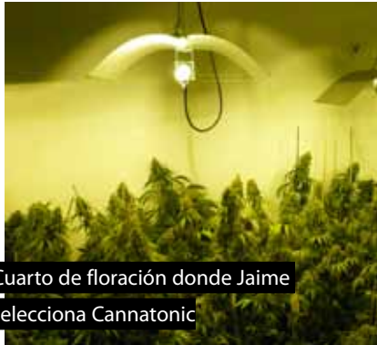
Cuarto de floración donde Jaime selecciona Cannatonic

Más tarde, me cuelo del salón al cuarto de trabajo de Anna, donde lleva toda la