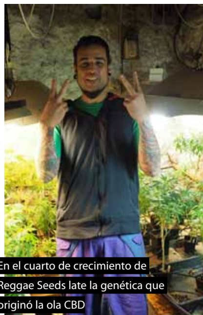
En el cuarto de crecimiento de Reggae Seeds late la genética que originó la ola CBD

La ola CBD empezó en Girona y allí se mantuvo los primeros años, a un ritmo lento, pero seguro, en los últimos años ya se conoce en todo el mundo. Es tiempo de una actualización de aquellos históricos primeros artículos del 2011. Aunque son los más completos que se han publicado