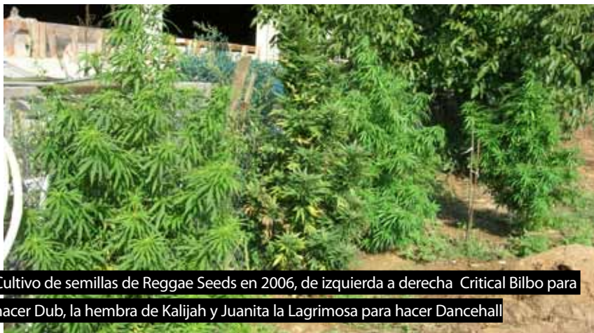
Cultivo de semillas de Reggae Seeds en 2006, de izquierda a derecha Critical Bilbo para hacer Dub, la hembra de Kalijah y Juanita la Lagrimosa para hacer Dancehall